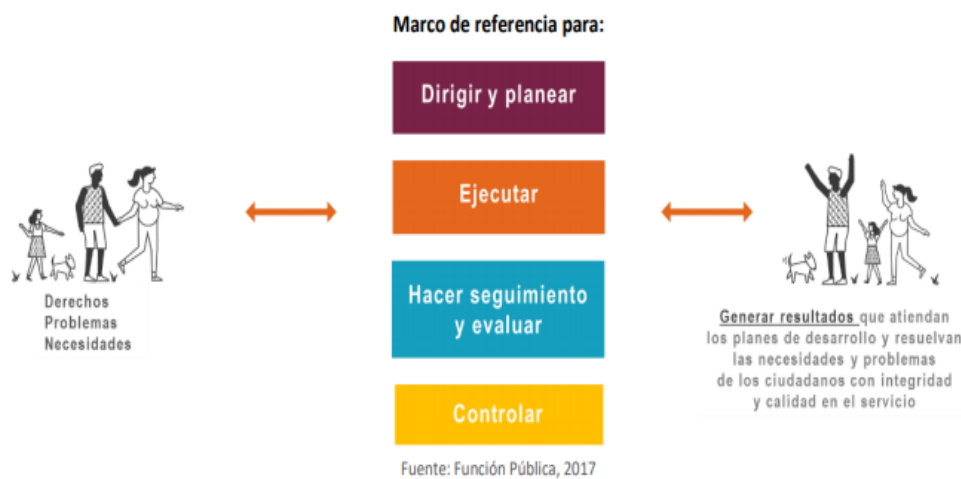
Gráfico 2. Definición del Modelo Integrado de Planeación y Gestión –MIPG

Es un marco de referencia para dirigir, planear, ejecutar, hacer seguimiento, evaluar y controlar la gestión de las entidades y organismos públicos, con el fin de generar resultados que atiendan los planes de desarrollo y resuelvan las necesidades y problemas de los ciudadanos, con integridad y calidad en el servicio.